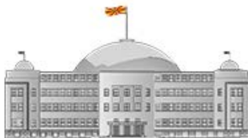
СОБРАНИЕ НА РЕПУБЛИКА СЕВЕРНА МАКЕДОНИЈА